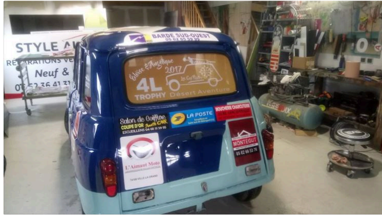
Deux élèves infirmières d'Auch en route pour le 4L Trophy

Eloïse Crevoisier et Angélique Lagarde seront sur la ligne de départ