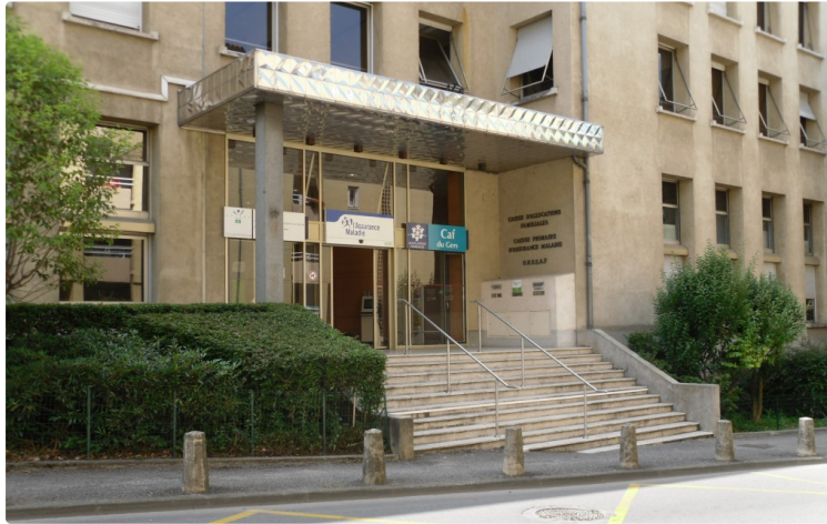
LES 3 ORIENTATIONS DE L'ASSURANCE MALADIE POUR 2017

Pendant la période des travaux, dès ce lundi 13 février jusqu' à juin 2017, l'accueil aura lieu au 52 rue Dessoles, dans l'espace Santé Plus Gers. Parallèlement, afin de limiter la gêne occasionnée par ce déménagement, un conseiller demeurera rue de Chateaudun pour orienter les assurés vers le contact idoine . Horaires d'ouverture 8h 30 /12h 30 et 14h /17 h .