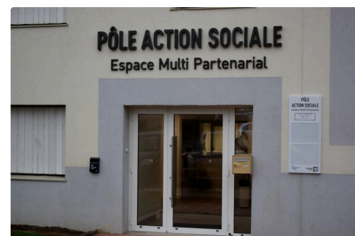
Le Pôle d'action sociale multi-partenarial quartier du Garros qui intégrera le Centre d'exams de santé à compter du 22 février