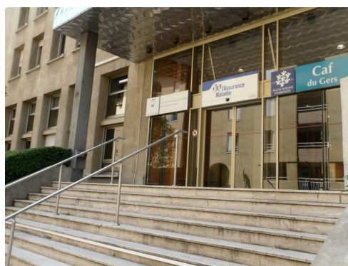
Le siège rue de Chateaudun