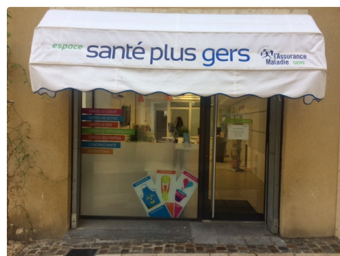
L'espace Santé Plus Gers au 52 rue Dessoles ouvert au public , sur rendez vous , dès lundi

« Tous ces projets s'inscrivent dans une volonté d'amélioration de la qualité de service rendu aux usagers : expliquer le fonctionnement du système, éclairer les droits, faciliter les démarches, mais aussi dans celle de répondre aux besoins des Gersois en matière d'accès à la santé en luttant contre les inégalités sociale en santé » a confié Serge Boyer .