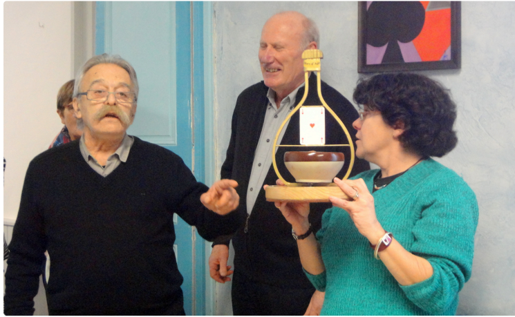
CONDOM: Bridge et gastronomie: la suite.

Quand le cassoulet rencontre la poule farcie.