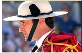
Conférence et film à Eauze