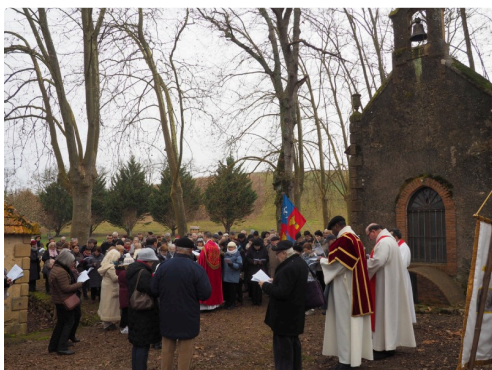
pelerinage st fris lac 1.jpg

Par la suite, la salle des fêtes du village accueillait les pèlerins qui partageaient là, un repas tiré du sac selon la formule consacrée.