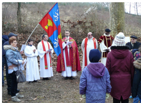
Pèlerinage St Fris 1.jpg