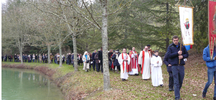
Pèlerinage à St Fris

L'appel lancé par le conseil pastoral de l'Astarac auprès de la communauté catholique pour faire revivre le pèlerinage de Saint Fris à Bassoues a fait écho auprès des populations locales puisque dimanche dernier près de 300 pèlerins de toutes générations ont assisté au terme du parcours qui les menait de la fontaine miraculeuse à la basilique à l'office religieux.