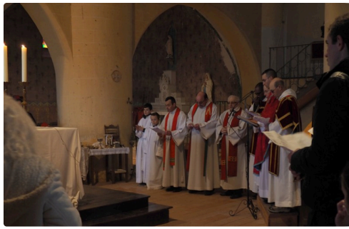
pèlerinage st fris basilique.jpg