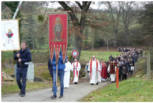
Pèlerinage St Fris 4.jpg