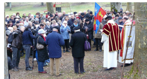
Pèlerinage St Fris 2.jpg