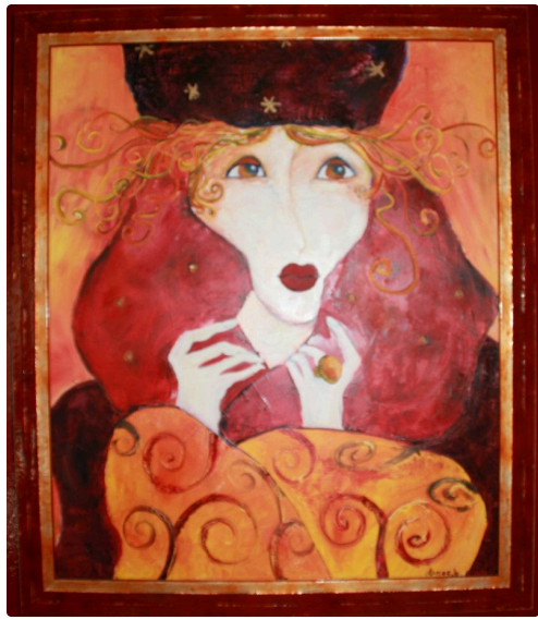
toile de Nathalie Burak