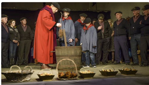
Après la représentation, on prépare la bénédiction du fruit de la vigne