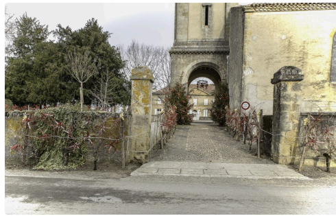
L'entrée de l'église