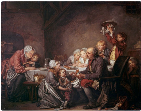
LE GÂTEAU DES ROIS. 1774 Jean-Baptiste GREUZE (1725 - 1805)