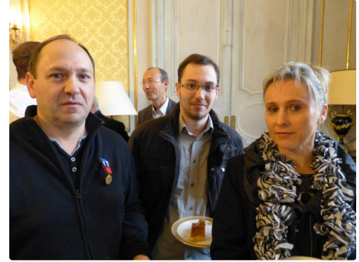
La famille du récipiendaire.