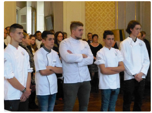
les apprentis à l'honneur.