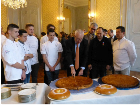
Mr le Préfet roi de la découpe.