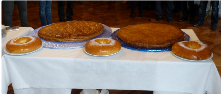
La galette à la Préfecture.

Mardi 10 janvier les artisans de la fédération des artisans boulangers et boulangers-pâtisseries du Gers ont apporté la galette à M. Pierre Ory, Préfet du Gers Une tradition nationale et gersoise qui se perpétue depuis plus de quinze ans. Cette année, c'est la boulangerie-pâtisserie CHAMBRIER de Condom qui a réalisé deux immenses galettes à la crème d'amande.