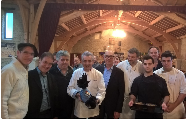
Chapons, pouardes et autres volailles sont encore à la fête