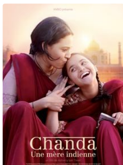
affiche du film