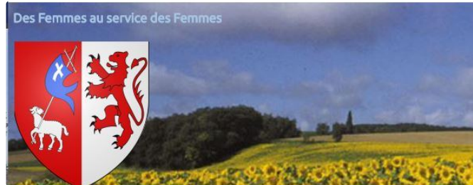
Retour sur la soirée " droits des femmes " avec le club Soroptimist Auch-Armagnac

Le club Soroptimist Auch-Armagnac organisait début décembre, à Ciné 32 Auch, l'avant-première du film «Chanda, mère indienne » qui sortira sur les écrans le 4 janvier 2017, suivi d'un débat sur la condition féminine.