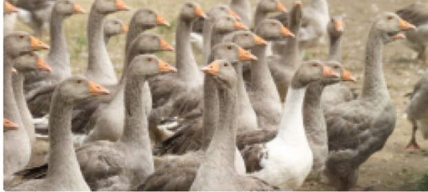
Hécatombe de volailles gersoises suite au virus H5N8 mis a jour 26/12/2016

28 élevages plus de 100 000 volailles touchés par le virus