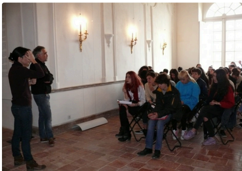
Les élèves de seconde du Lycée Bossuet de Condom (section arts visuels) ont questionné les deux artistes.

L'œuvre [M]ondes est visible dans le réfectoire des moines de l'abbaye de Flaran jusqu'au 2 janvier.