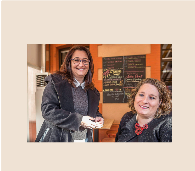
Nogaro – Les nounous suivent régulièrement des formations

Surtout sur les premiers secours aux enfants