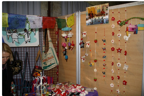
Gers Himalaya 15122016 007 (Copier).JPG