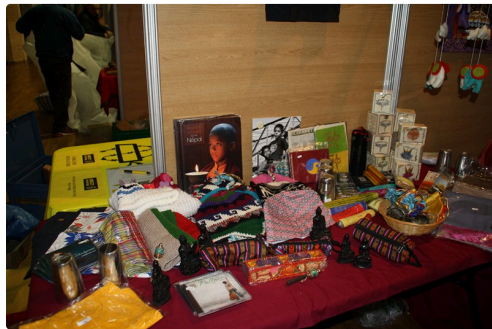
Gers Himalaya 15122016 005 (Copier).JPG