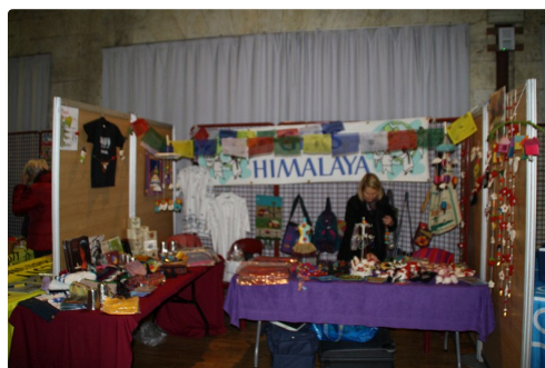
Gers Himalaya 15122016 003 (Copier).JPG