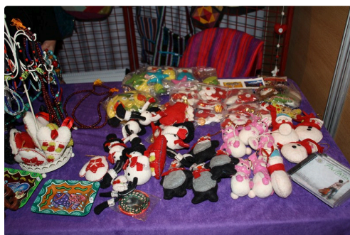
Gers Himalaya 15122016 008 (Copier).JPG