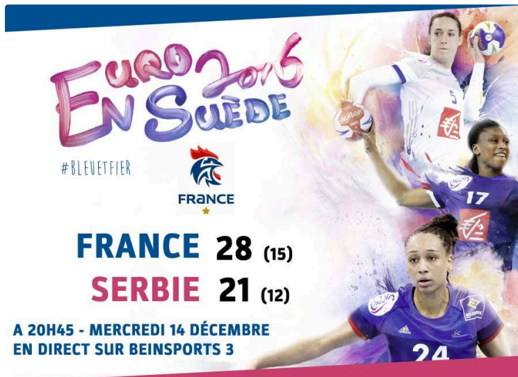
Handball: La France a obtenu son billet pour les demi-finales de l'Euro 2016