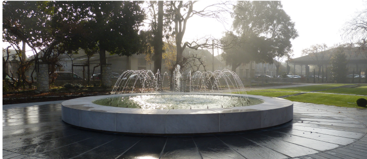
Le jardin ORTHOLAN fait peau neuve.

Rajeunissement pour ce parc centre ville datant de 1936