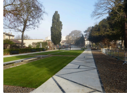
le nouveau ORTHOLAN en attendant le printemps.