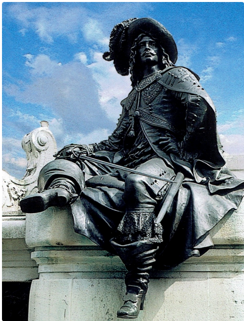
Lupiac ( D'Artagnan)