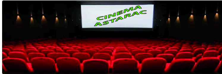
MIRANDE Cinéma Astarac

Mercredi 16 septembre 20h30 : Human 3h11mn Documentaire français de Yann Arthus-Bertrand À travers les témoignages remplis d'amour, de bonheur, mais aussi de haine et de violence, HUMAN nous confronte à l'Autre et nous renvoie à notre propre vie. De la plus petite histoire du quotidien, jusqu'aux récits de vie les plus incroyables, ces rencontres poignantes et d'une sincérité rare, mettent en lumière ce que nous sommes, notre part la plus sombre mais aussi ce que nous avons de plus beau et de plus universel. La Terre, notre Terre, est sublimée au travers d'images aériennes inédites accompagnées de musique tel un opéra, qui témoignent de la beauté du monde et nous offrent des instants de respiration et d'introspection.