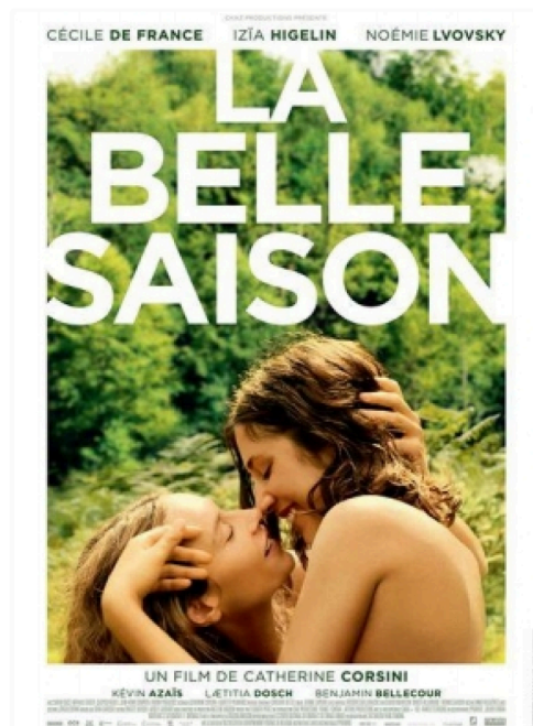
cinema labelle saison.jpg