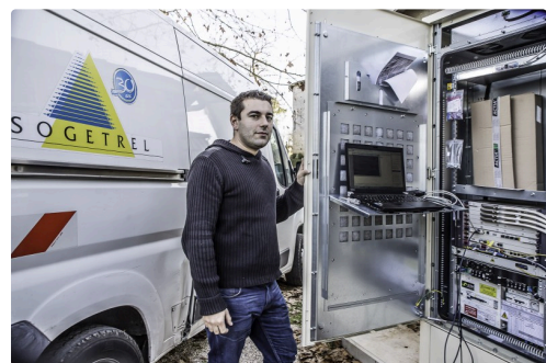
Le technicien travaille au sous-répartiteur de l'église de Bouzon