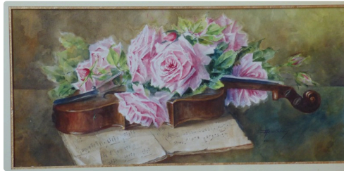
une peinture de Madeleine Doubrère