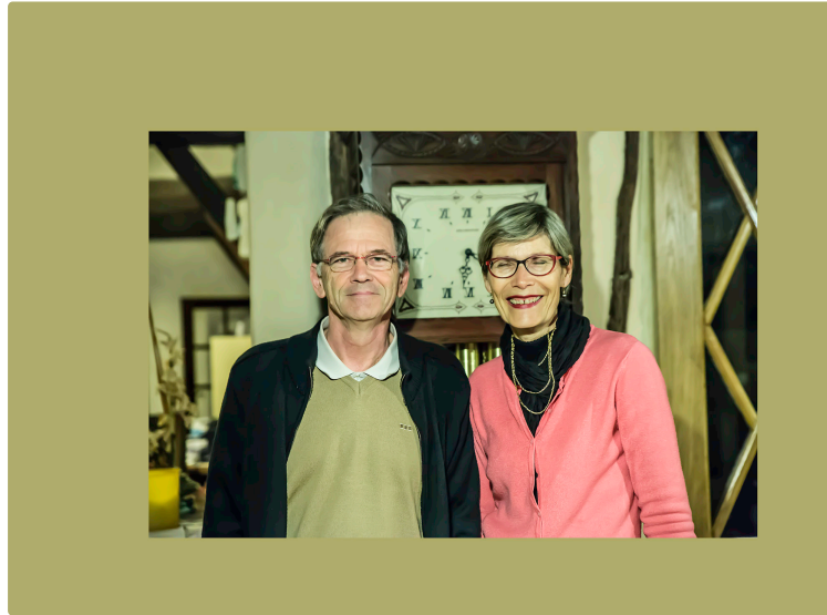
Nogaro et Sorbets – L'orthographe rectifiée s'apprend plus facilement