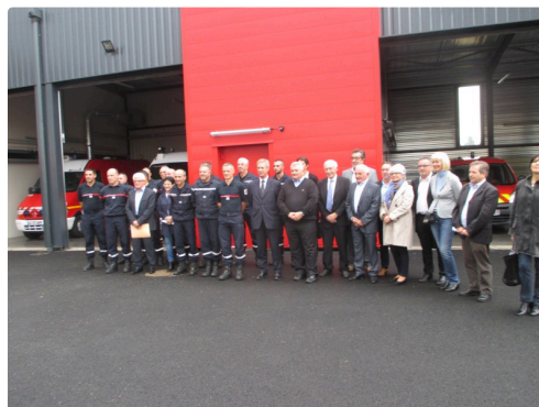
Rassemblement du C.A. du S.D.I.S devant la nouvelle caserne