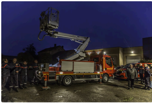
Démarrage d'un essai du bras élévateur articulé