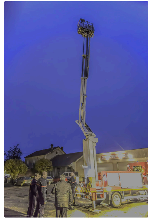
La nacelle est à sa hauteur maximale