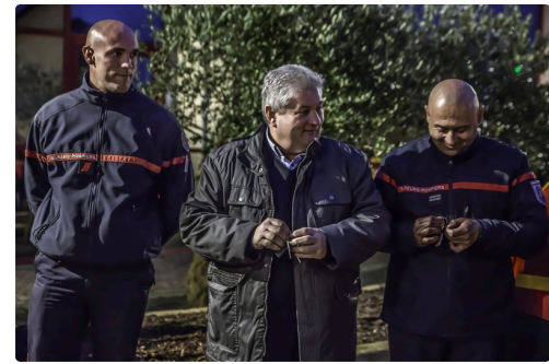
Les clefs des véhicules sont prêtes