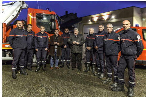
Tous se déplacent vers le camion porteur du bras élévateur articulé