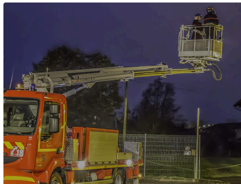
C'est parti pour un tour