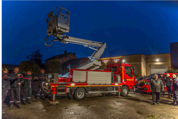
Nogaro – Les sapeurs-pompiers reçoivent un bras élévateur

Les sapeurs-pompiers du Centre principal de secours (CPS) de Nogaro, commandés par le lieutenant Pascal Barbier, ont reçu depuis quelques jours plusieurs véhicules, dont un camion équipé d'un bras élévateur articulé qui peut monter jusqu'à 19,50 mètres. Tous les conducteurs de poids lourds du Centre ont déjà été formés à l'utilisation de ce bras élévateur.