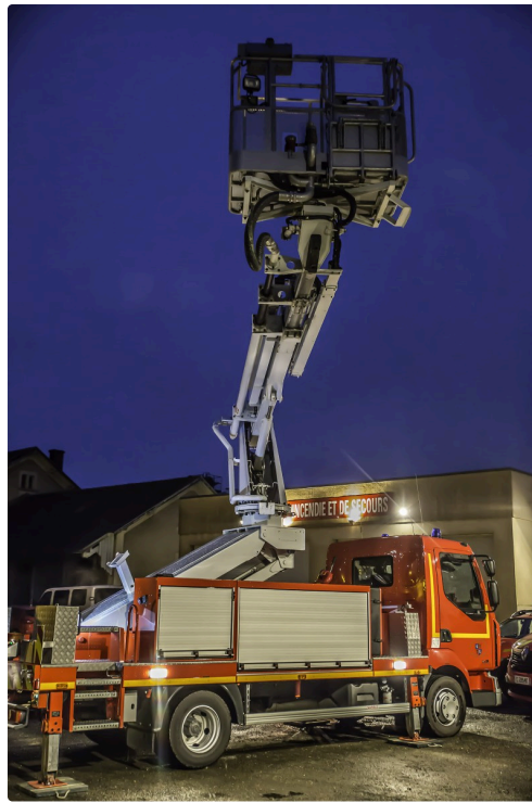
Le bras monte