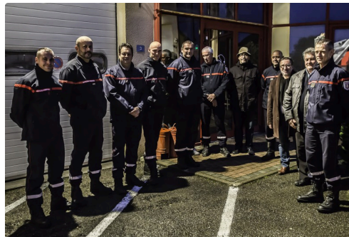
Les autorités et les sapeurs-pompiers présents