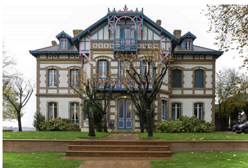
Le Château de Laubade