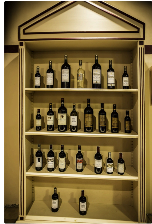
L'éventail des vins de LEDA (Laubade et domaines associés)