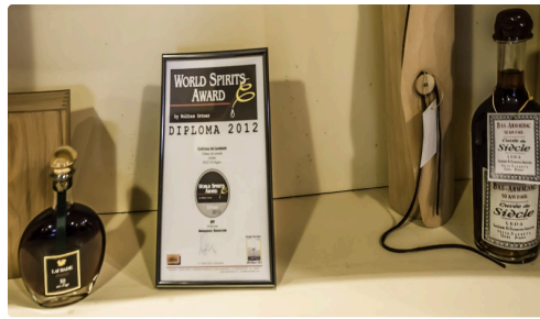
Un bas-armagnac du Château de Laubade