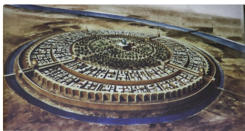
La ville de Bagdad au VIIIe siècle - Document présenté par Idriss Aberkane