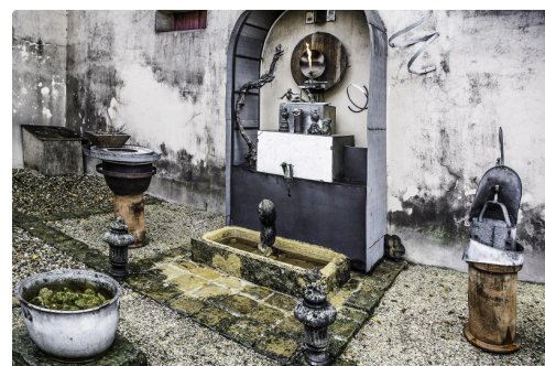
La "chapelle" en l'honneur des ancêtres, des vigneron, du terroir etc. Noter la statue de Leda et de son cygne (Leda comme Laubade et domaines associés)