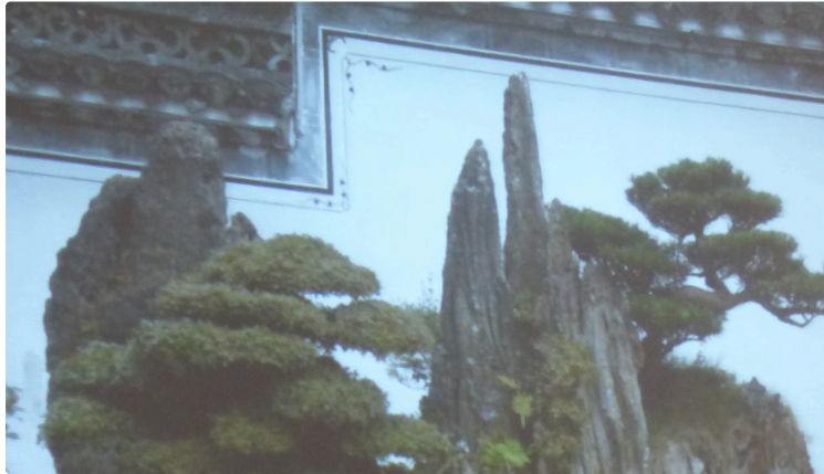
Jardins chinois, jardins japonais