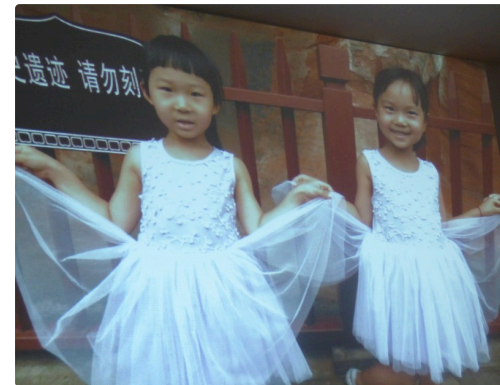
jolies jeunes filles