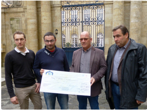
La délégation FDSEA et JA du Gers avec le chèque à signer de 9 millions d'euros