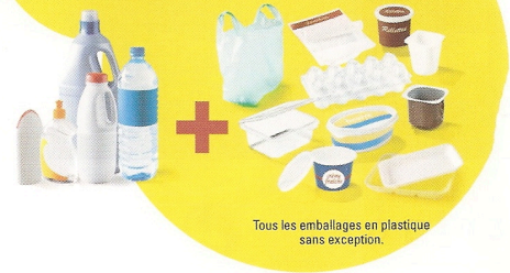
Tous les emballages en plastique sans exception.

Vous continuez à déposer dans votre bac de tri tous les emballages métalliques, les emballages en carton, les papiers et, en plus de cela, tous vos emballages en plastique sans exception.