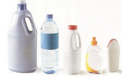
Bouteilles et flacons en plastique.

Vous déposiez dans votre sac/bac de tri tous les emballages métalliques, les emballages en carton, les bouteilles et flacons en plastique.