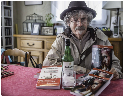
...et posant volontiers en Bob Marlowe, fameux détective privé héros de Raymond Chandler