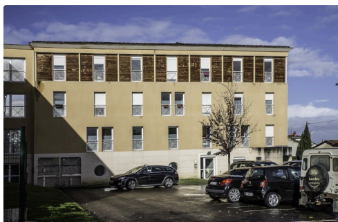
L'hôpital de Nogaro a de multiples entrées