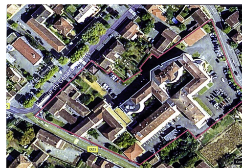
Vue aérienne de l'hôpital entouré de violet