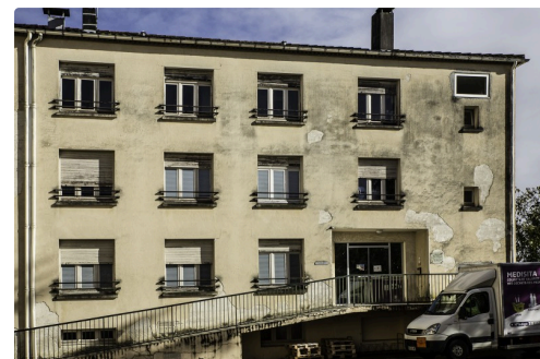
Un des bâtiments voués à la destruction