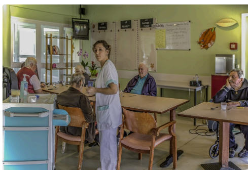
Salle à manger de la maison de retraite