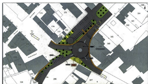
Projet communal du carrefour avenue des Pyrénées-avenue du Général-Leclerc (l'hôpital actuel est à droite en gris)