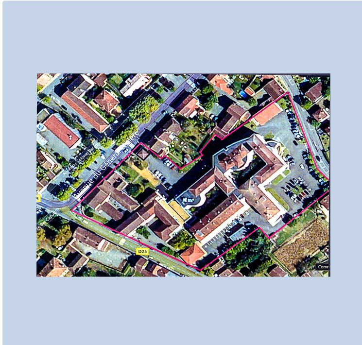
Nogaro - « Pré-projet » de travaux à l'hôpital débloqué

On en parle depuis 10 ans, des travaux de restructuration à faire à l'hôpital de Nogaro. Eh ! Bien, Nadine Thomas, la directrice, que nous avons rencontrée le 15 novembre, a bon espoir que la situation se débloque, puisqu'un « pré-projet » a été examiné le 28 d'octobre par les instances compétentes. Pourquoi « pré-projet » ? Parce qu'il laisse en suspens plusieurs décisions, mais que beaucoup d'autres sont actées. Et les objectifs de la transformation des locaux sont approuvés.