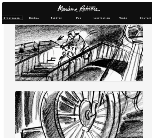
Screen Shot Micmac Jeunet.png