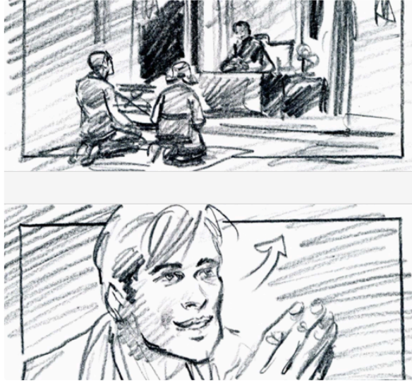
Cinéma l'Europe a Plaisance