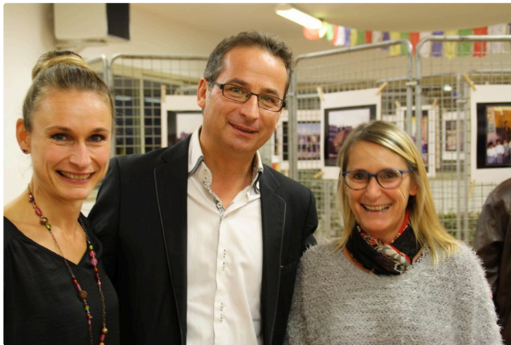
Gers Himalaya : l'association attend votre aide

Les associations Gers Himalaya et Regards croisés sur le Népal sont associées pour éditer un ouvrage de photographies de tags, peintures murales, recensées en marchant dans les rues de Katmandou, capitale du Népal. Le plus symbolique est certainement cette inscription en rouge apparue après le 25 avril 2015 : Earthquake 2015 04 15. Bien d'autres sont des messages d'hygiène et propreté quotidienne. D'autres encore... Achetez cet ouvrage et vous découvrirez la suite.