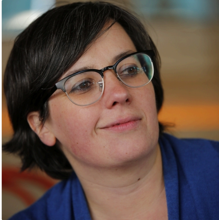
"Diada" du 7 novembre

Clarification des rapports entre Occitans et Catalans