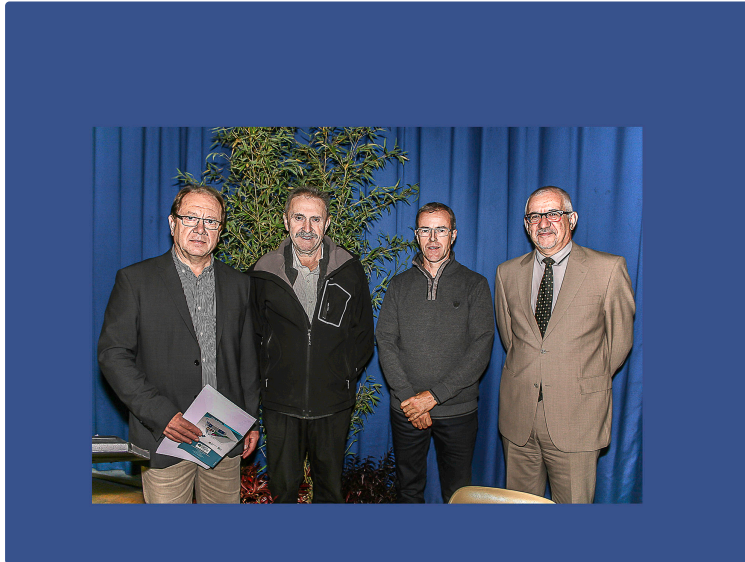
Nogaro – 1e table ronde sur l'innovation vécue au Siel

3 chefs d'entreprise racontent leur parcours