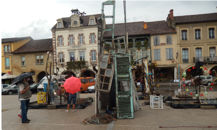
MARCIAC Les Mythimages

Cette quatrième édition du salon d'art populaire de Marciac a retrouvé son public malgré une météo très défavorable. La manifestation s'inscrit désormais dans le calendrier des grands rendez vous de la ville. Le salon invite en même temps à la découverte de la ville en parcourant ses rues où sont disséminées les différentes galeries et ateliers qui accueillent cette année une quarantaine d'artistes. Peinture, sculpture, photo, dessin, et livres d'arts y trouvent leur place et s'offrent en libre accès le temps d'un week-end à un public qui peut à l'occasion rencontrer les artistes et échanger avec eux. Résolument tourné vers l'art contemporain la manifestation est soutenue par les collectivités locales et régionales pilotée par l'Espace Eqart au sein de l'association les mythimages