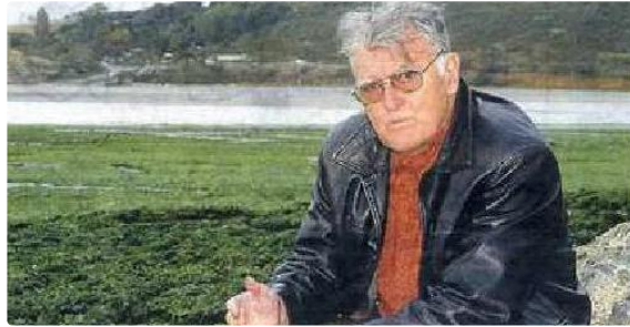
Auch : Mercredi 9 novembre, conférence et débat public sur polluants aériens et santé publique