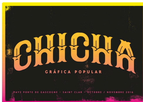
Chicha St-Clar R.jpg