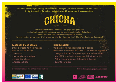
Chicha St-Clar V.jpg

Ce projet est porté par Culture Portes de Gascogne, et soutenu par la mairie de Saint-Clar, et les fonds européens Leader (demande en cours).