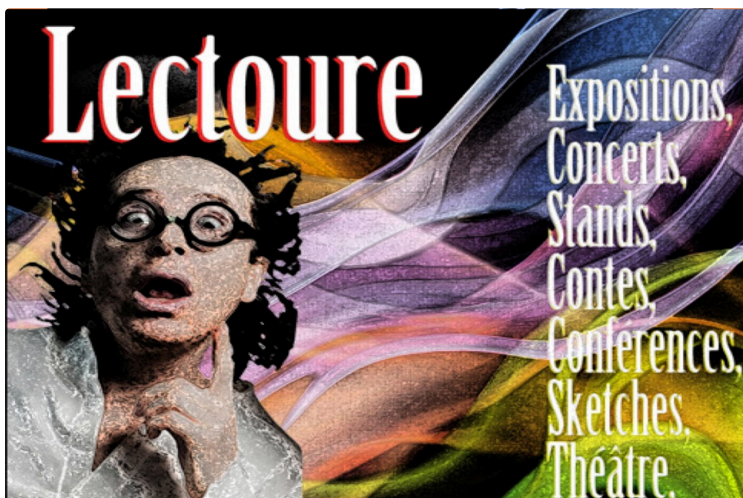
Vous avez dit bizarre, comme c'est bizarre ce festival de tous les arts

Théâtre, musique, photos, peinture, lecture faites votre choix