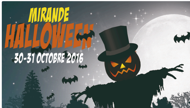
Le grand rendez-vous d'Halloween

La sous préfecture plongée dans l'étrange