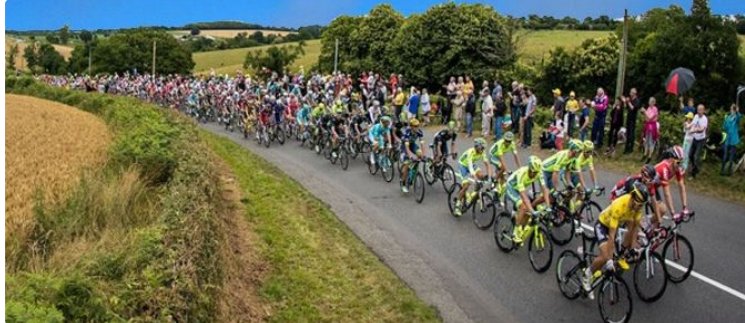
Le bilan financier du Tour de France