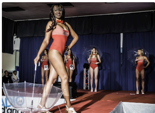
Chorégraphie de la future Miss Prestige Gascogne