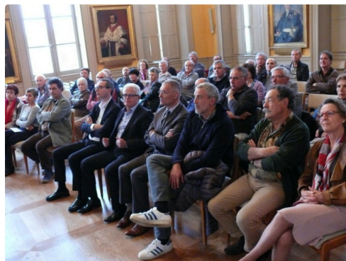
De nombreux membres d'associations de randonneurs étaient présents.