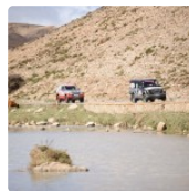
rose des sable 87.jpg