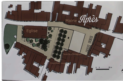
Le projet d'aménagement