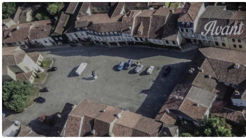
La place actuelle