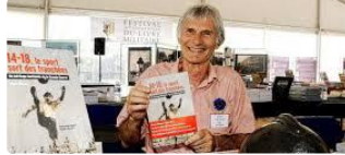
Conférence : Le sport, un héritage de la Grande guerre

Elle aura lieu à la préfecture le vendredi 14 octobre à 18 h 30