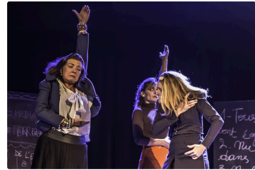
12 Suite 1bis 091016.jpg