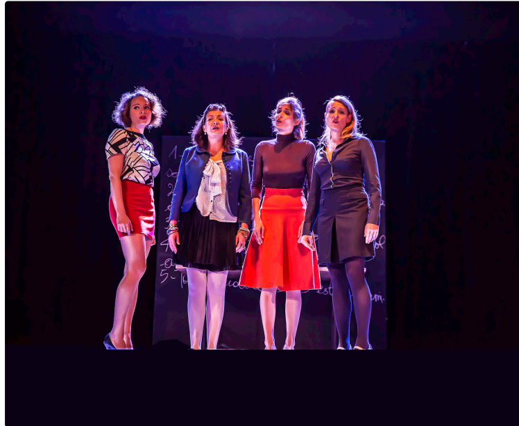
Nogaro – Les z'OMNI tout en mimiques et grimaces

Les 4 filles ont joué la révolte des animaux