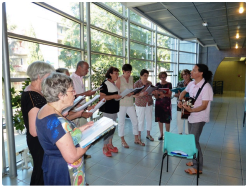
L'assemblée commence par un mini récital de la chorale de l'association :