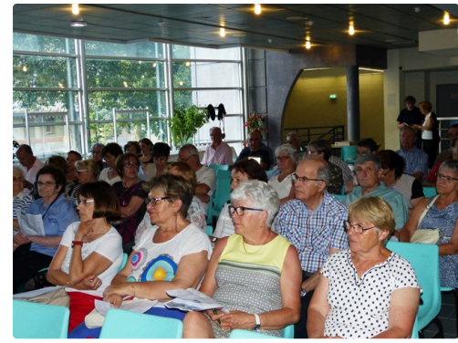
Une assistance studieuse.