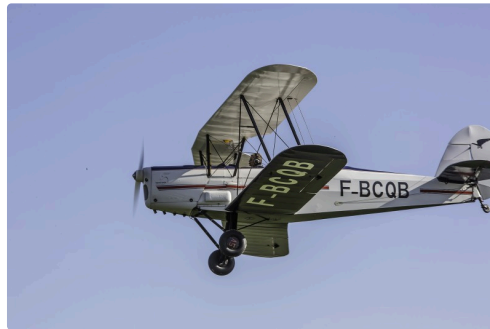
Un Stampe SV 4