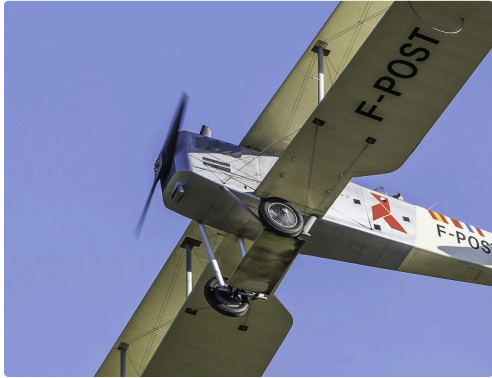
Il va se poser