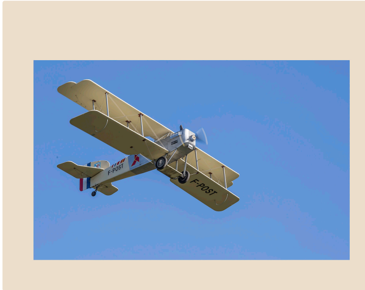
Nogaro – Les vieux coucoux étaient là

La foule de Classic Festival les a vus en l'air et à terre