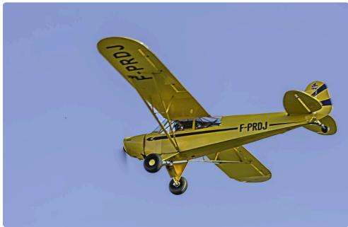
Wag-Aero Sport Trainer