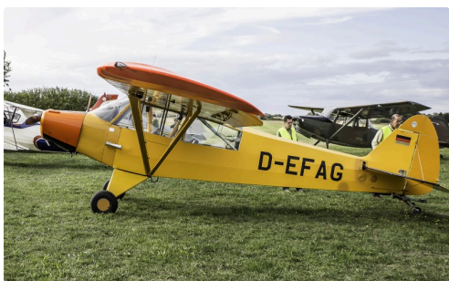
Piper Cub 18-90