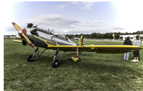
Le fameux Ryan de 1939