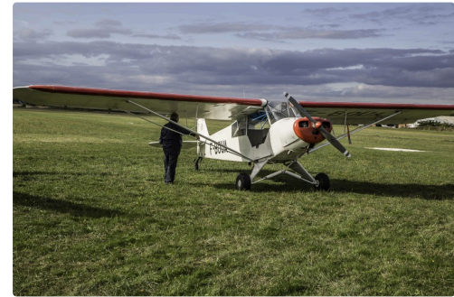
Un autre Piper Cub