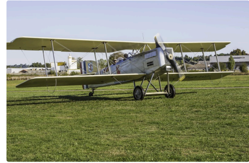
Il a atterri