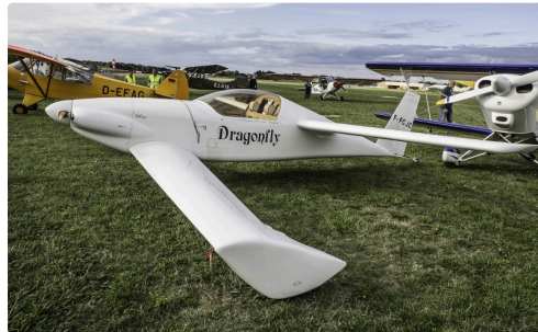
Dragon Fly Viking