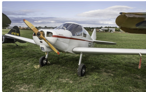
Le Jodel D11X