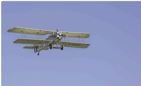
Le Bréguet XIV arrive

Tous ces avions ont été vus en vol à leur arrivée et à leur départ et les photographes ont apprécié ce spectacle exceptionnel à tous égards.