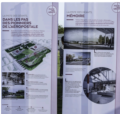
Panneaux sur l'histoire de l'Aéropostale