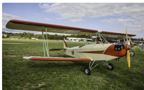
26 Leopoldoff 1bis 091016.jpg