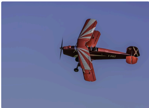
Le Bücker Jungmann (RFA), construit pour la Voltige