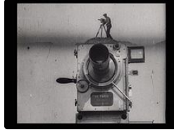
Deuxième festival du cinéma muet

L' Homme à la Caméra un véritable " Caviar" pour les cinéphiles