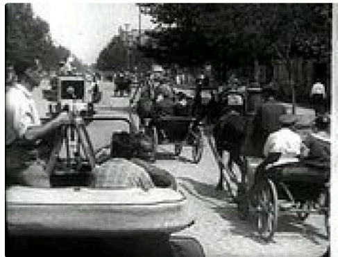
On suit l'opérateur durant le tournage