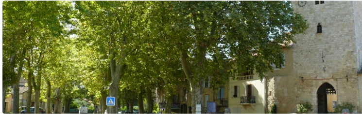
Les platanes de la discorde

Une réunion publique est prévue à la salle des fêtes de Sarrant le 4 octobre entre la municipalité et la population