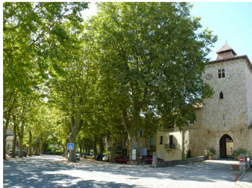
Le platane prêt de la Tour Porte sera épargné ...

25 platanes dépendent du domaine départemental et 12 dépendent de la commune. Sept platanes seraient conservés dont quatre autour de la vierge, deux devant le cimetière et un proche de la Tour Porte. Les 28 platanes sur les 30 abattus seraient remplacés par des platanes de 4 à 6 mètres de haut et résistants au chancre coloré.