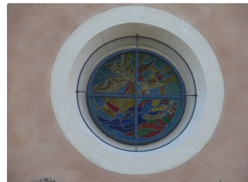
Songe de Saint-Joseph