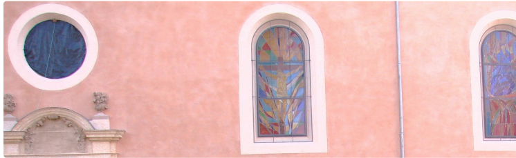
AUCH La façade nord de la maison diocésaine plus resplendissante que jamais

Mgr Maurice Gardès a inauguré et béni les trois nouveaux vitraux de la chapelle.